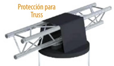
Protección para Truss